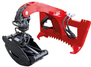
Verladezangen mit festem Ausleger

EMS Ersatzteil- und Maschinen-Service AG Land-, Forst- und Kommunaltechnik Gewerbe Badhus 23, CH-6022 Grosswangen Tel. 041 980 59 60 info@ems-grosswangen.ch www.ems-grosswangen.ch