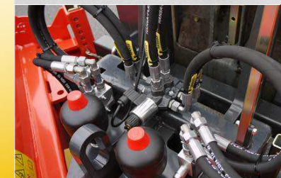
Soupape de commutation électrique avec protection contre les surcharges par deux soupapes de limitation de pression et bulles d'azote