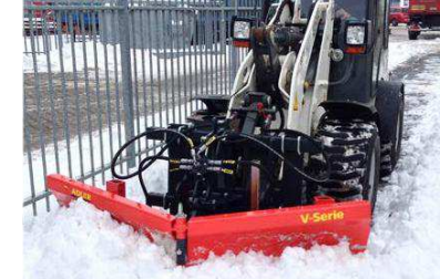
Série V attelage à la grue agricole