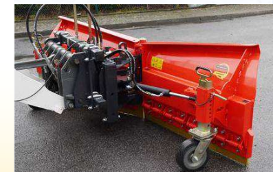
NOUVEAU ! Également disponible dans les largeurs de travail de 210 cm à 330 cm