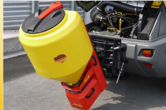
Système d'attelage universel rabattable