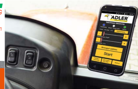
La vitesse et le débit sont réglés confortablement à partir de la cabine du conducteur