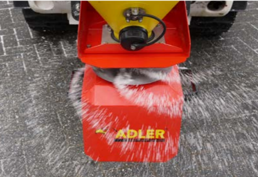
Moteur-réducteur à 12 volts pour le disque d'épandage