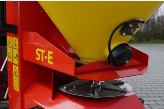
Largeurs d'épandage jusqu'à 6 m, réglables par la vitesse.