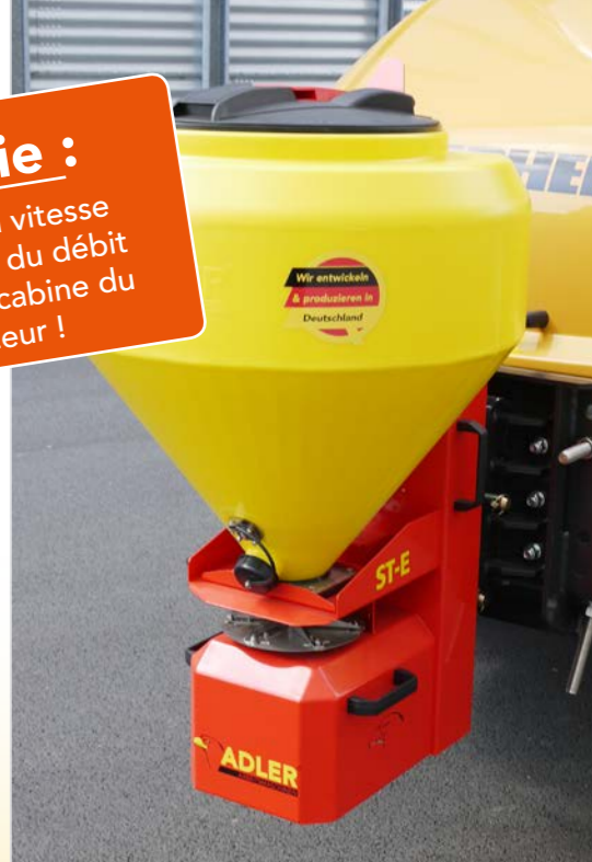
Saleuse pour valets de fermes / chargeuse sur roues

De série : Réglage de la vitesse de rotation et du débit à partir de la cabine du conducteur !