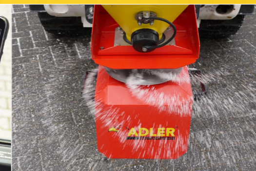
12-Volt-Getriebemotor für den Streuteller