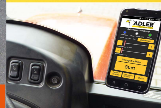
Drehgeschwindigkeit und Ausbringungsmenge werden bequem per Smartphone aus der Fahrerkabine eingestellt