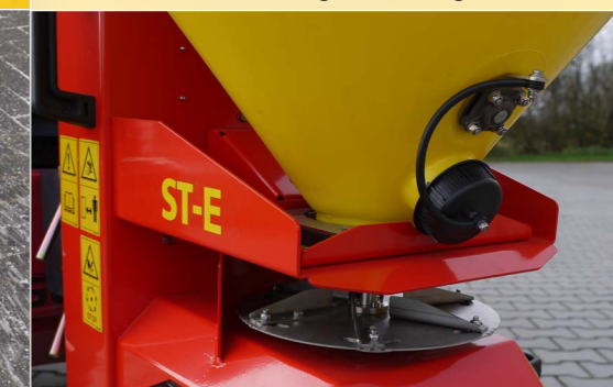
Streuweiten bis zu 6 m, regelbar über die Drehzahl