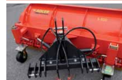
Arbeitsbreiten von 150 cm bis 270 cm