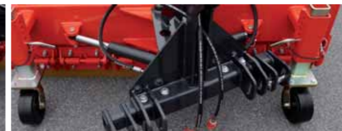
Universalaufnahme mit hydraulischer Verschwenkung