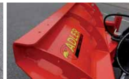
6 mm starkes Schneeräumschild